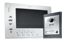
VsystemPro Portier vidéo professionnel