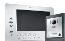
VsystemPro Portier vidéo professionnel